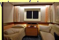
Cabine extérieure standard

-les cabines sont toutes avec toilettes, douche, télévision, minibar, coffre