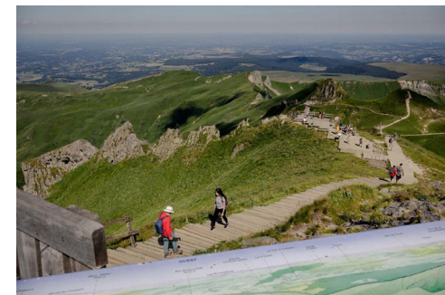
Puy de Sancy