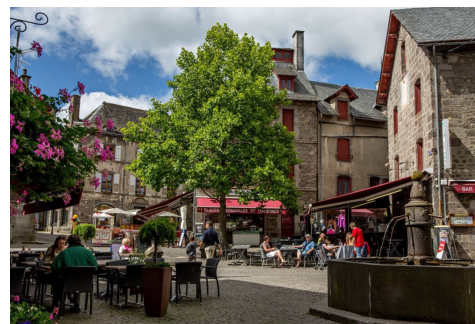
Vieille ville de Besse

Et pourquoi pas trouver le partenaire idéal pour la suite du séjour.