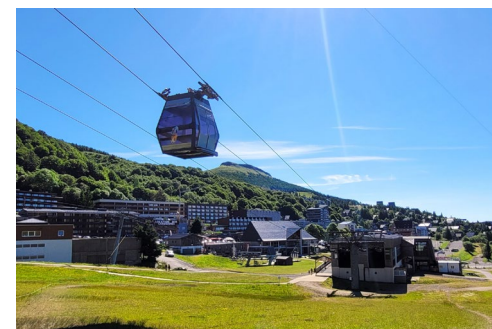
Télécabine de la Perdrix

Samedi 27 juin Après le petit-déjeuner : libération des chambres. Départs, non sans prendre rendez-vous pour de prochaines aventures