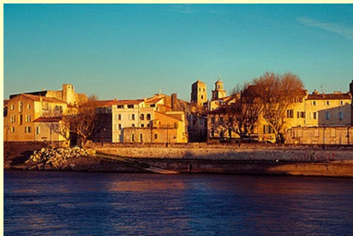
Ci-dessus : Arles, les quais, et image de droite le fameux pont d'Avignon devant le Palais des Papes

Toutes les cabines donnent sur l'extérieur, avec fenêtre et sont équipées de douche et WC, TV, sèche-cheveux, coffre-fort et radio. Salle à manger pouvant accueillir tous les passagers en un seul service. Excellente cuisine, appréciée à maintes reprises par les bridgeurs... ! Longueur 110m, largeur : 11,40m. Un vrai bon confort, et bien sûr, pas de mal de mer à redouter. Salon-bar panoramique, qui permettra de jouer au bridge sans rien perdre du paysage !