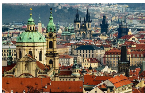
Les toits de Prague