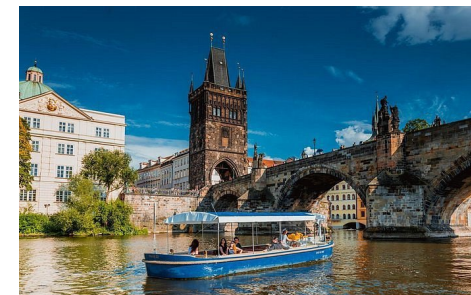
Possibilité de croisière sur la Vltava