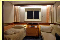
Cabine extérieure standard

-les cabines sont toutes avec toilettes, douche, télévision, minibar, coffre