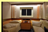
Cabine extérieure standard

-les cabines sont toutes avec toilettes, douche, télévision, minibar, coffre