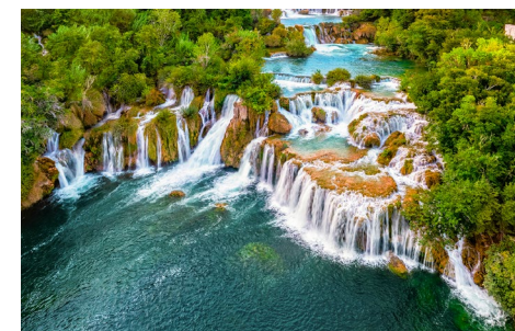
Les Cascades de Krka