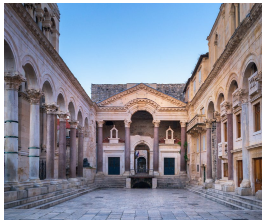
Palais de Diocletien