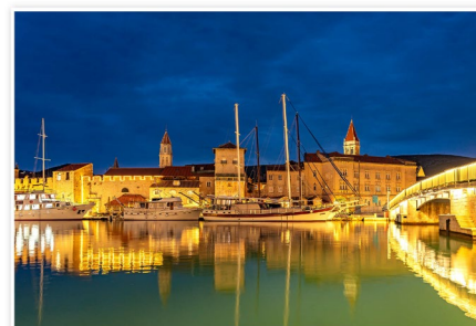
Le port de Trogir