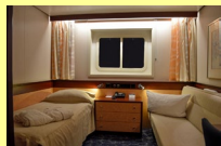
Cabine extérieure standard

-les cabines sont toutes avec toilettes, douche, télévision, minibar, coffre