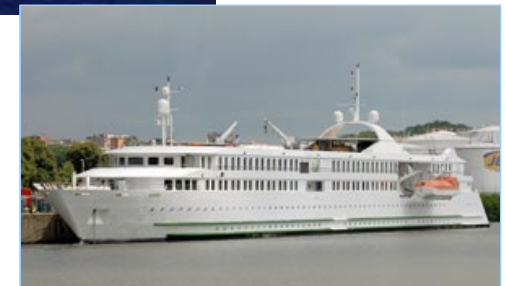
Le MS Belle de l'Adriatique, mini-paquebot ou gros yacht

Avec vol Paris / Dubrovnik Départ possible de Province sur demande