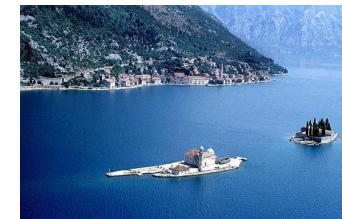
Bouches de Kotor

Ne pas manquer la navigation vers Kotor dans la matinée, c'est sublime. Les bouches de Kotor sont insolites : la mer y pénètre sur plusieurs kilomètres, formant de multiples baies aux eaux calmes