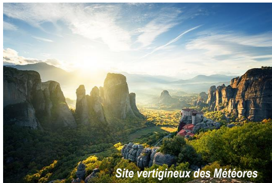
Site vertigineux des Météores