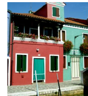
Burano : rouge contre vert !

Petit déjeuner à bord. Débarquement à partir de 9h. Fin des services personnelle.