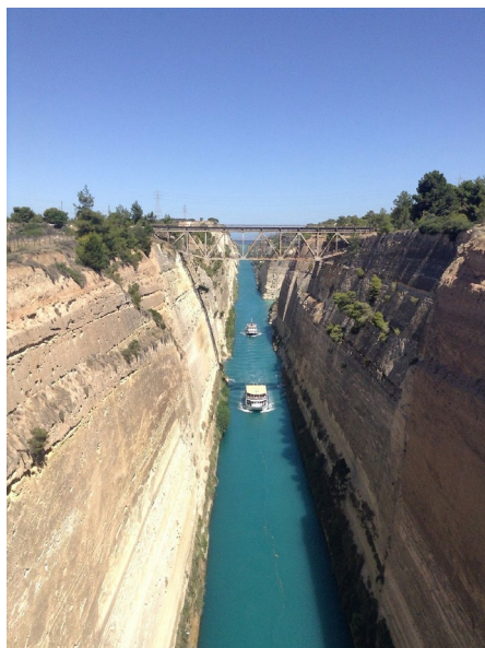
Canal de Corinthe

Le Péloponnèse a forgé l'histoire de la Grèce, avec ses mythes et ses héros. Paysages bucoliques, sites antiques culturels, Canal de Corinthe, chemins de randonnée, criques sauvages. Sans conteste l'une des plus belles régions de Grèce.