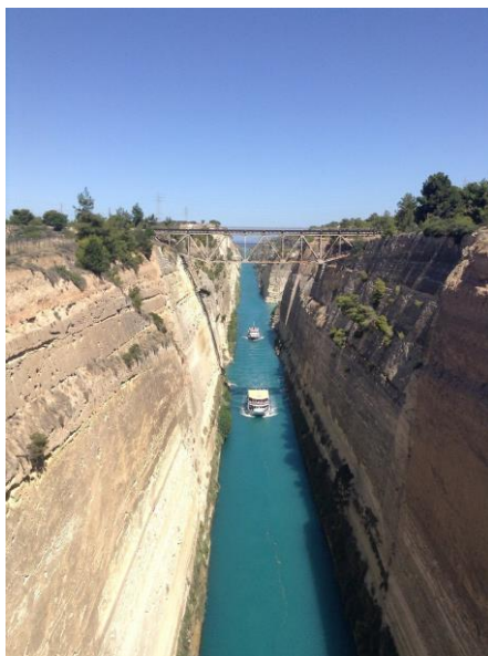
Canal de Corinthe

Le Péloponnèse a forgé l'histoire de la Grèce, avec ses mythes et ses héros. Paysages bucoliques, sites antiques culturels, Canal de Corinthe, chemins de randonnée, criques sauvages. Sans conteste l'une des plus belles régions de Grèce.