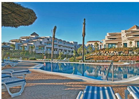
Un hôtel de luxe posé sur un golf.