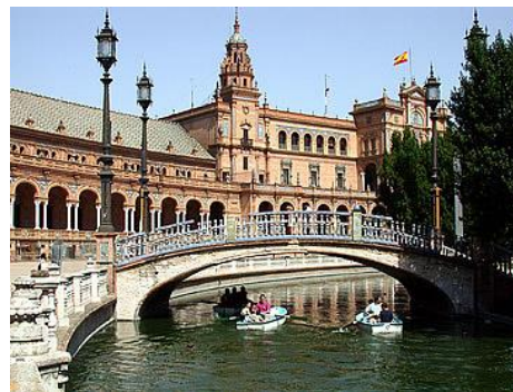
Séville, la Place d'Espagne

Journée libre pour une éventuelle excursion lointaine (facultative) vers CORDOUE, ou SEVILLE