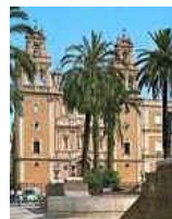
Huelva, la Merced

Matinée : On peut suggérer une excursion vers une des richesses touristiques de la région, Huelva, toute proche, dont l'attrait principal est le monastère de La Rabida, qui abrita Christophe Colomb à son départ pour les Indes. Non loin se trouvent les répliques de ses trois caravelles.