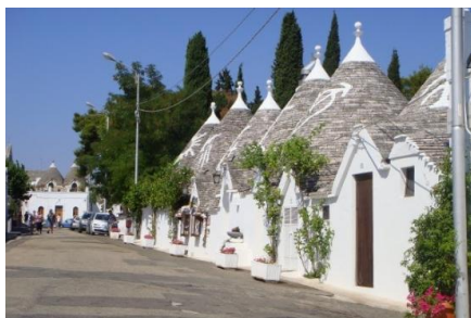
Les fameux Trullis