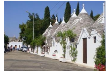
Les fameux Trullis

Excursion facultative de la journée. Visite de la ville d'Alberobello et ses célèbres trullis, petites constructions typiques de la région des Pouilles en Italie, construites en pierres avec un toit conique et souvent peintes en blanc