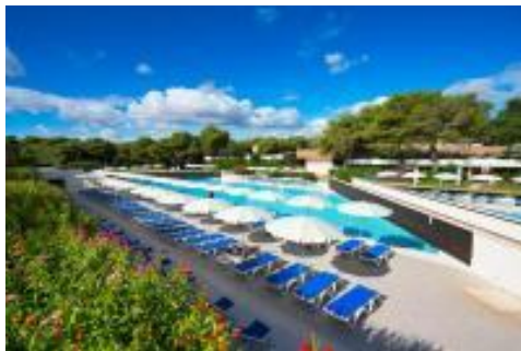
Bravo club Alimini