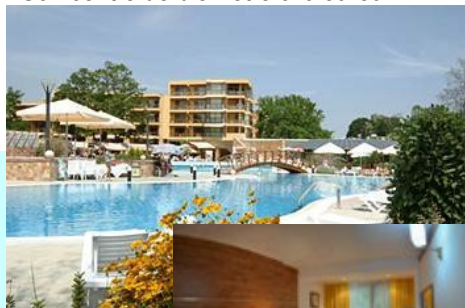
Grandes chambres avec vue sur parc ou sur mer