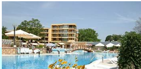
Grandes chambres avec vue sur parc ou sur mer