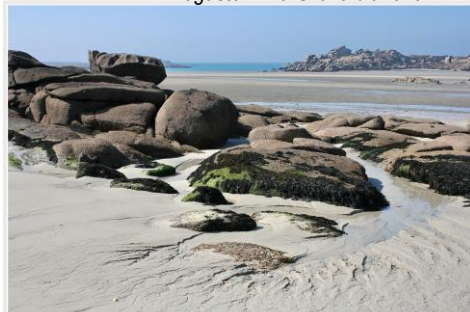
Tregastel – La Grève blanche

Trégastel charme tous les visiteurs qui découvrent ce site enchanteur. Ici la nature s'est surpassée : une beauté brute, une mer aux camaïeux changeants, partout des chaos de granit rose aux formes extraordinaires. Paradis de la randonnée Trégastel vous accueille, pour des vacances ressourçantes dans un cadre exceptionnel.