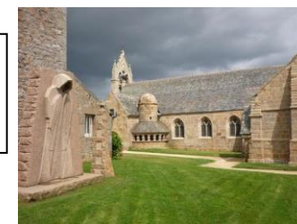
Le bourg de Tregastel