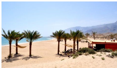
Plage de Sifah à 10mn à pied de l'hôtel