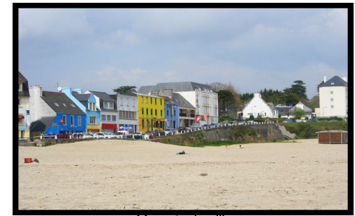
Morgat – le village