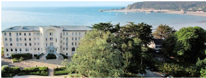
Le Grand Hôtel de la Mer, littéralement posé sur la plage