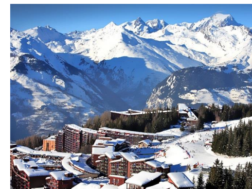
En haut le village au pied du Mont Blanc, en bas, les yeux au ciel, Laurent Thuillez

Les horaires des activités bridge et tourisme peuvent être modifiés en fonction des circonstances sur place. Tous les tournois sont homologués FFB (points d'expert)