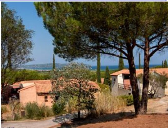
Les bungalows du village-club, noyés dans la pinède