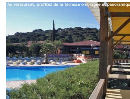
Le village-club Touristra : terrasse du restaurant,

Les bridgeurs séjournant pour le stage pendant ces dates sont invités pour les tournois du Festival.