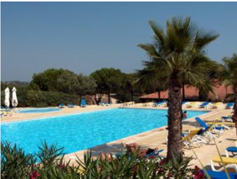
La piscine du village-club.

Un sentier traverse la pinède et permet de rejoindre la très belle plage de Pampelonne en 5 minutes. Des kilomètres de sable directement accessibles !