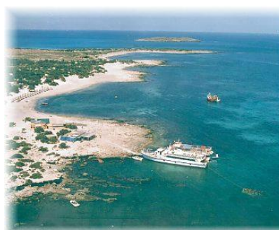
Ile de Chrissi

Matinée libre pour une éventuelle excursion, vers Elounda et Aghios Nikolaos par exemple, en ne négligeant pas la petite croisière vers l'île aux Lépreux, Spinalonga ! 16h30. BRIDGE. Simultané Octopus avec commentaire détaillé des 8 meilleures