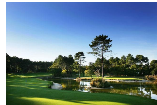
Golf de Seignosse, plébiscité même par les Anglais !

Matinée libre. Avez-vous testé votre swing sur le