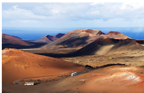
Lanzarote Parc de Timanfaya

Plages de sable noir, forêts luxuriantes, falaises abruptes, criques dénichées, vagues de dunes, pittoresques cités coloniales ou grandes villes palpitantes, une succession de contrastes saisissants.