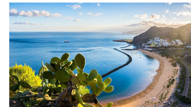
Plage de Santa Cruz de Tenerife

imposante cathédrale noire. Une visite des jardins de la marquise d'Arucas terminera cette visite en beauté. Vous pourrez y admirer quelques 400 espèces de plantes tropicales et subtropicales. Soirée de gala.