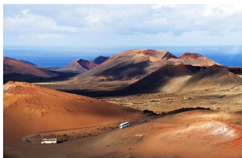
Lanzarote Parc de Timanfaya

Plages de sable noir, forêts luxuriantes, falaises abruptes, criques dénichées, vagues de dunes, pittoresques cités coloniales ou grandes villes palpitantes, une succession de contrastes saisissants.