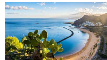
Plage de Santa Cruz de Tenerife

Vendredi 3 février : ARRECIFE Lanzarote Lanzarote est la plus originale des îles Canaries avec ses fascinants paysages de laves noires constellés d'oasis de verdure, caressés par des eaux d'un bleu intense. Matinée consacrée à l' excursion facultative dans le parc national de Timanfaya . Lanzarote ne ressemble à aucun autre endroit au monde. Les 3/4 de la surface de l'île sont couverts de cratères et de coulées de laves datant des éruptions volcaniques massives d'il y a 270 ans. Vous atteindrez les Montagnes de Feu pour admirer ce magnifique paysage lunaire. Puis, à Isote de Hilario, vous assisterez à des démonstrations géothermiques. L'après-midi, excursion facultative sur les traces de César Manrique , l'artiste le plus important des Canaries. Connue en tant que peintre, architecte, constructeur et sculpteur, il était aussi un écologiste qui abhorrait tous les signes de la construction moderne. BRIDGE. BRIDGE dans le cadre de SimultaNet. , dont les douze donnes plus intéressantes sont analysées par le duo d'experts Soulet / Debernardi. Palmarès et remise des prix, auxquels s'ajoute la très prisée Invitation « Week-end en croisière » pour le Master,