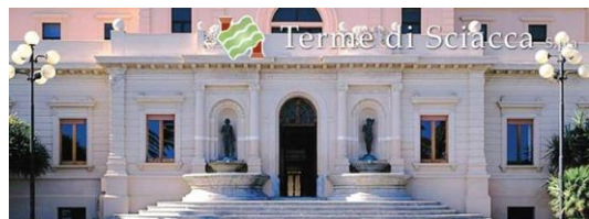
Sciacca – Station thermale renommée

L'ordre des tournois et des sorties pourra être modifié pour s'adapter aux circonstances locales