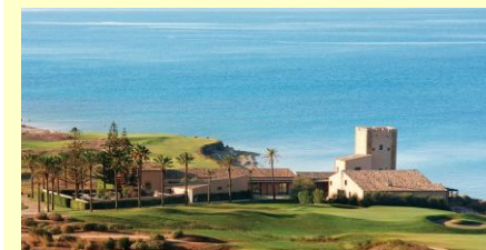
Sciacca – deux parcours de golf