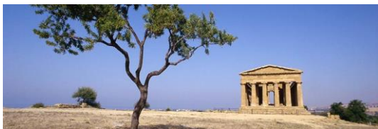
Agrigento – Vallée des Temples

Base parfaite aussi pour les visites des nombreux sites historiques proches.