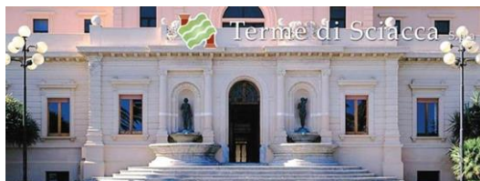
Sciacca – Station thermale renommée

L'ordre des tournois et des sorties pourra être modifié pour s'adapter aux circonstances locales