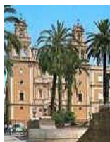
Huelva, la Merced