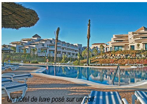
Un hôtel de luxe posé sur un golf.

Autre régal : la table. Déjeuner- buffet au Marismas, dîner servi au Rompido. Boissons comprises à volonté.