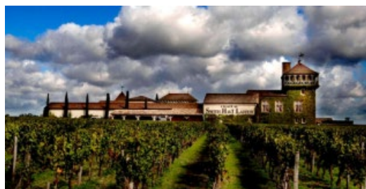
Château Smith Haut Lafitte

Un terroir de prestige. Une mosaïque de paysages, complexe en couleurs, textures et ambiances. Seul parcours des croisières en Aquitaine qui s'accommode d'un programme d'activités bridge. En profitant des temps de navigation, souvent en matinée, pour pratiquer toutes les formes de tournoi de Bridge sans rien perdre du paysage grâce au salon panoramique qui abritera nos joutes.