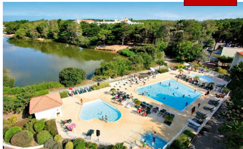
Club Belambra « Les Grands Espaces »