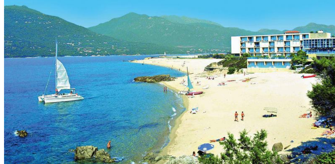
Hôtel-club Belambra Arena Bianca, posé sur la plage