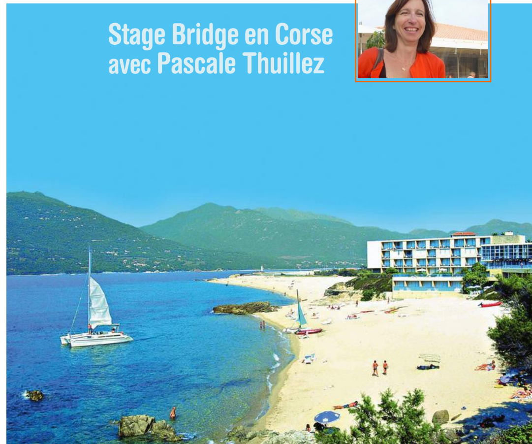
Hôtel-club Belambra Arena Bianca, posé sur la plage