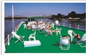
Grand pont soleil

Formalités : Carte Nationale d'Identité ou Passeport en cours de validité