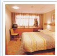
Cabines, toutes avec salle d'eau et grande fenêtre

90 cabines. Longueur 115m, largeur : 12m Un vrai bon confort, et bien sûr, pas de mal de mer à redouter. Toutes cabines équipées de douche et wc, sèche-cheveux, coffre, TV, radio, fenêtres, climatisation, deux lits bas ou un grand lit,