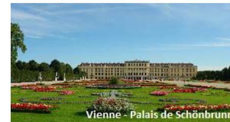
Vienne - Palais de Schönbrunn

L'après-midi excursion commune aux deux forfaits,