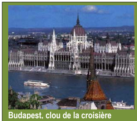
Budapest, clou de la croisière

Tarif : 430 € / personne (taxe 85€ comprises)