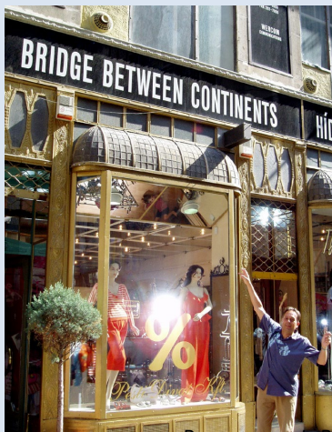
Dans une rue de Budapest...

Toutes cabines équipées de douche et wc, sèche-cheveux, coffre, TV, radio, fenêtres, climatisation, deux lits bas ou un grand lit, Wifi gratuit. Et une table qui fait les délices des bridgeurs les plus exigeants.