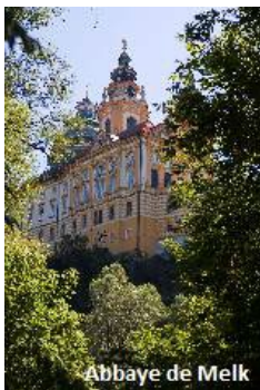
Abbaye de Melk

Excursion facultative commune aux deux forfaits. Visite guidée de l'abbaye de Melk. Couronnant une