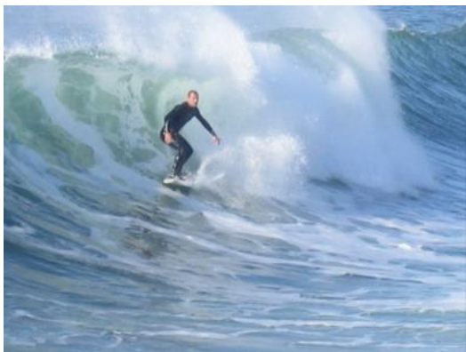
Admirer les surfeurs depuis son balcon est un spectacle captivant