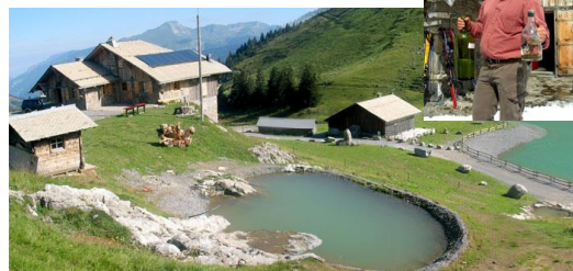
Le chalet de Nyon et les bassins à truites