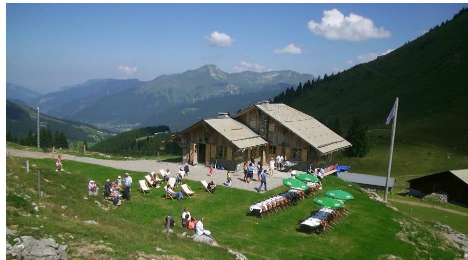
Raclette conviviale au Chalet d'altitude