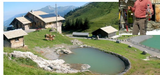
Le chalet de Nyon et les bassins à truites

Pour vous faire apprécier les jolis coins du domaine de Morzine, et en même temps encourager la convivialité vous est proposée la journée « Top » du séjour, au Chalet de Nyon, le refuge d'altitude de l'Equipe, que vous atteindrez par une agréable et facile randonnée pédestre. (Pour ceux qui ne pourraient marcher, la direction de l'hôtel les emmènera en 4x4). Avec l'apéritif, vos animateurs vous proposeront un sujet de circonstance, suggéré par l'altitude et le décor : « Quiz des sommets » Puis déjeuner -raclette en plein air mijoté par super-chef Patrick. Et le tout pourra se compléter d'une partie de pêche à la truite dans le lac voisin. Truites à déguster au dîner ce soir.