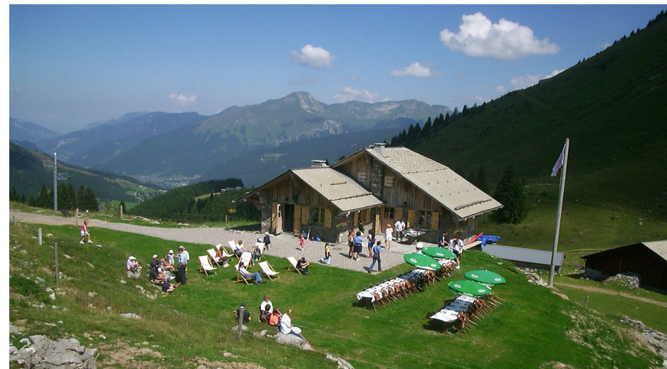
Raclette conviviale au Chalet d'altitude