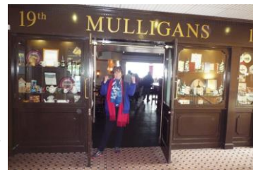
Mulligans Le Pub de l'hôtel, avec live music