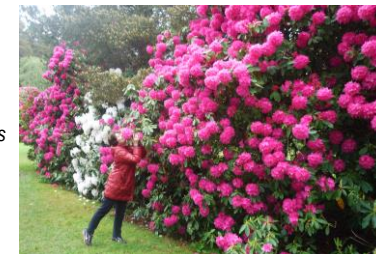
Rhodod géants dans le parc de Muckross

20h. Tournoi dans le cadre du Bridge Event