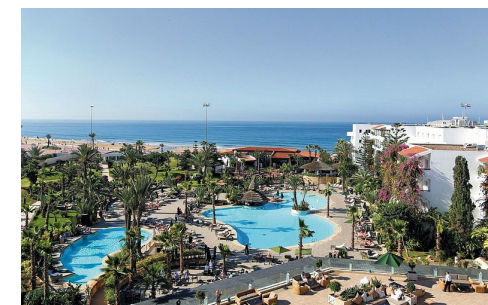
Hôtel RIU TIKIDA BEACH