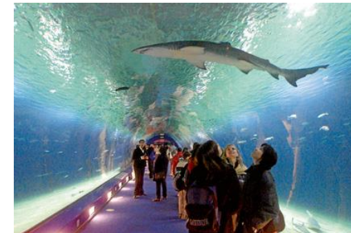
Le parc Océanographique

... En fin de matinée, transfert à l'aéroport. Envol prévu à 15h50, arrivée à Roissy à 17h55