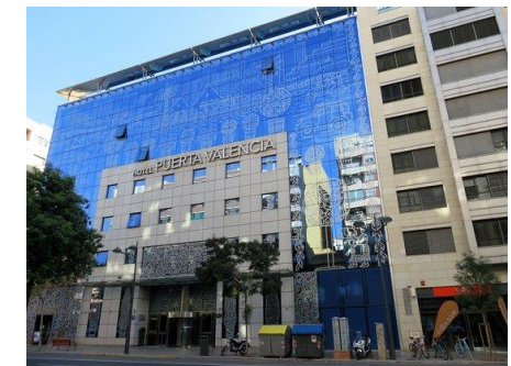
Hôtel Silken Puerta Valencia

Tous les tournois sont homologués FFB (points d'expert). L'ordre des séances bridge et de tourisme pourrait être modifié pour s'adapter aux circonstances locales