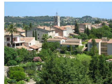
La Colle sur Loup

Matinée. Stage : les déclarations à Sans-Atout