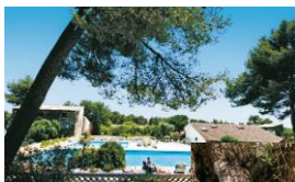
Parc aux oliviers centenaires

Bar lounge avec terrasse Piscine avec 3 bassins 3 courts de tennis 2 terrains de pétanque Animations en soirée