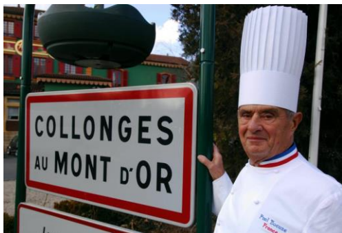
Escale gastronomique chez Paul Bocuse à Collonges,

LYON, LA VALLEE DU RHONE, LA CAMARGUE, ET LA PROVENCE Un tourbillon de saveurs sucrées et salées entre dégustation de chocolat à Tain l'Hermitage et dîner gastronomique à l'Abbaye de Collonges Paul Bocuse