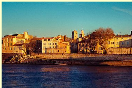
Ci-dessus : Arles, les quais, et image de droite le fameux pont d'Avignon devant le Palais des Papes

Toutes les cabines donnent sur l'extérieur, avec fenêtre et sont équipées de douche et WC, TV, sèche-cheveux, coffre-fort et radio. Salle à manger pouvant accueillir tous les passagers en un seul service. Excellente cuisine, appréciée à maintes reprises par les bridgeurs... ! Longueur 110m, largeur : 11,40m. Un vrai bon confort, et bien sûr, pas de mal de mer à redouter. Salon-bar panoramique, qui permettra de jouer au bridge sans rien perdre du paysage !