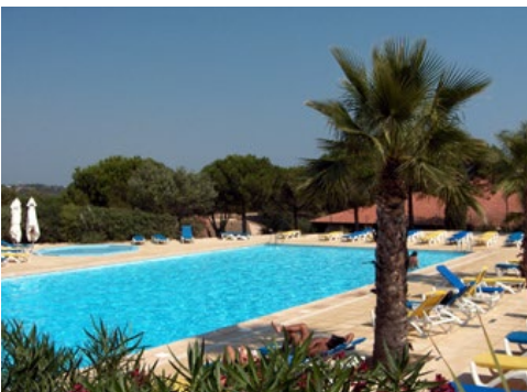
La piscine du village-club.

Un sentier traverse la pinède et permet de rejoindre la très belle plage de Pampelonne en 5 minutes. Des kilomètres de sable directement accessibles !