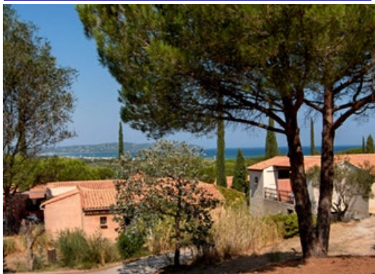
Les bungalows du village-club, noyés dans la pinède