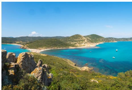
Bridge dans un cadre idyllique

A signaler : le village-club est bien placé tout près de la plage, mais donc isolé. Un véhicule personnel est vivement recommandé sur place.