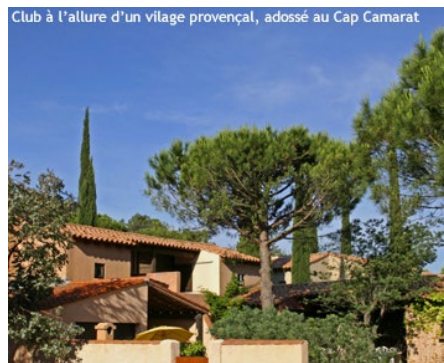
Club à l'allure d'un village provençal, adossé au Cap Camarat

Un environnement magnifique. Adossé au Cap Camarat, non loin du vieux village de Ramatuelle, le Village-Club est blotti au cœur d'une nature exceptionnelle : collines couvertes de vignobles et pinèdes, aux flancs desquelles s'accrochent les pittoresques villages varois, à deux pas des plages protégées du littoral. La bonne carte pour des vacances reposantes, avec en bridge juste ce qu'il faut pour progresser en se distrayant, pour s'amuser sans s'agacer.