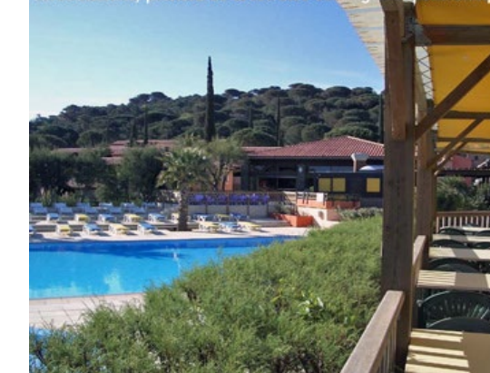
Le village-club Leo Lagrange : terrasse du restaurant,

Au restaurant, profitez de la terrasse ombragée et panoramique