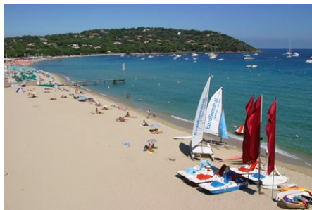
Plage mythique de Pampelonne

Un environnement magnifique. Adossé au Cap Camarat, non loin du vieux village de Ramatuelle, le Village-Club est blotti au cœur d'une nature exceptionnelle : collines couvertes de vignobles et pinèdes, aux flancs desquelles s'accrochent les pittoresques villages varois, à deux pas des plages protégées du littoral. La bonne carte pour des vacances reposantes, avec en bridge juste ce qu'il faut pour progresser en se distrayant, pour s'amuser sans s'agacer.