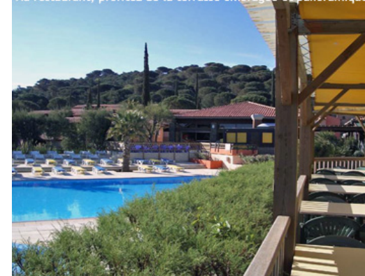
Le village-club Touristra : terrasse du restaurant,

Au restaurant, profitez de la terrasse ombragée et panoramique