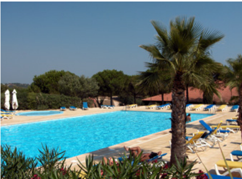
La piscine du village-club.

Un sentier traverse la pinède et permet de rejoindre la très belle plage de Pampelonne en 5 minutes. Des kilomètres de sable directement accessibles !