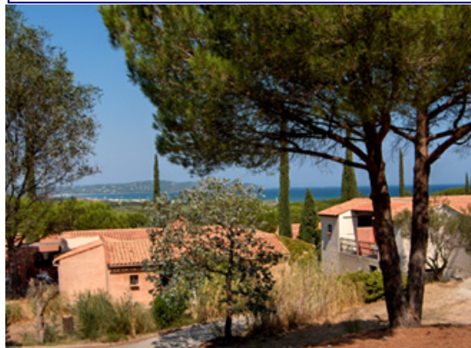
Les bungalows du village-club, noyés dans la pinède