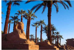
Temple de Louxor

Visite du temple de Karnak , construit par les pharaons de la XIX ème dynastie, il est le plus grand ensemble religieux jamais construit. Il se compose de sanctuaires, pavillons, pylônes et obélisques dédiées aux dieux thébains et à la gloire des pharaons. Déjeuner à bord.