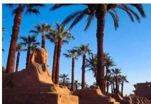
Temple de Louxor

Visite du temple de Karnak, construit par les pharaons de la XII ème dynastie, il est le plus grand ensemble religieux jamais construit. Il se compose de sanctuaires, pavillons, pylônes et obélisques dédiées aux dieux thébains et à la gloire des pharaons. Déjeuner à bord.