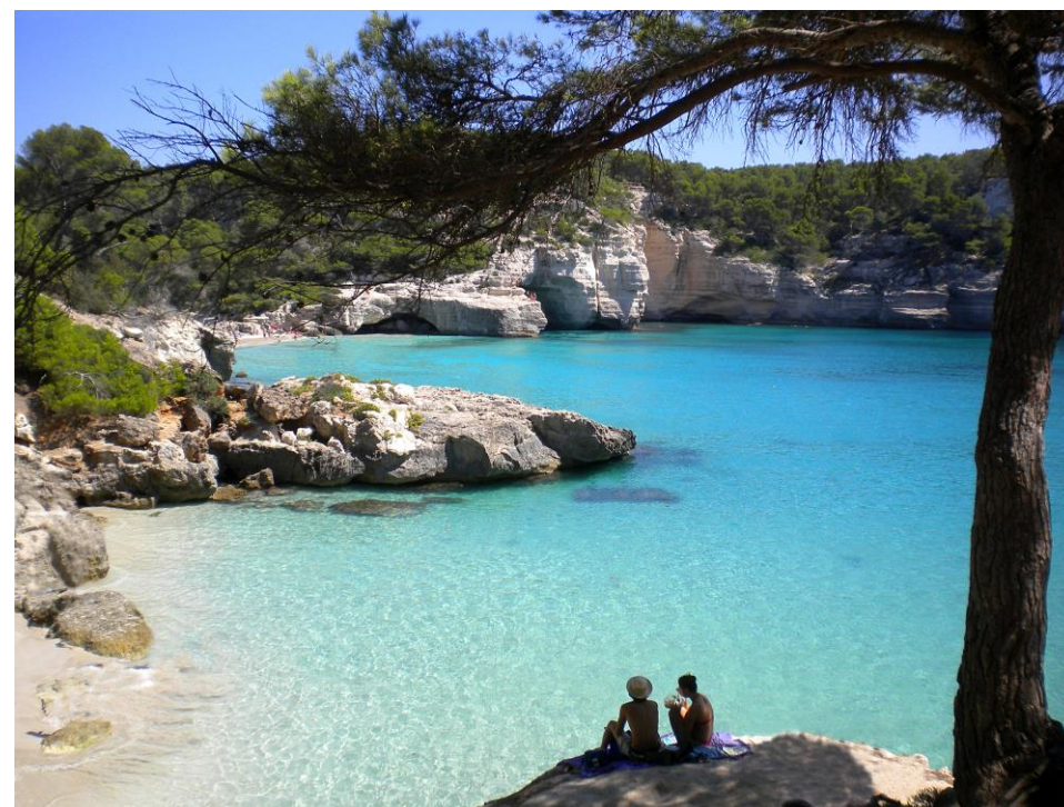
Plages secrètes enchevêtrées parmi les criques

Départs de : Paris, Lyon et Nantes (départs de Province sous réserve de disponibilité au moment de la réservation)