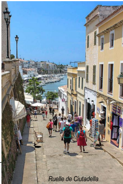
Ruelle de Ciudadella

Le Bravo Club Menorca est à seulement 11 km de Ciudadella , petite ville très animée avec ses restaurants de poissons autour de son petit port et ses nombreux bars à tapas.