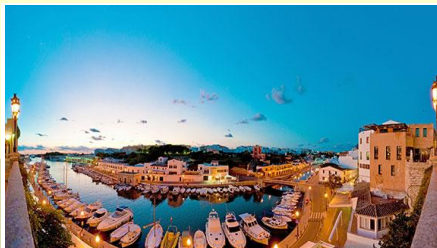
Petit port de Ciudadella

Matinée : plage ou piscine, éternel et cruel dilemme !