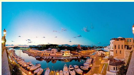
Petit port de Ciudadella

Matinée : plage ou piscine, éternel et cruel dilemme !