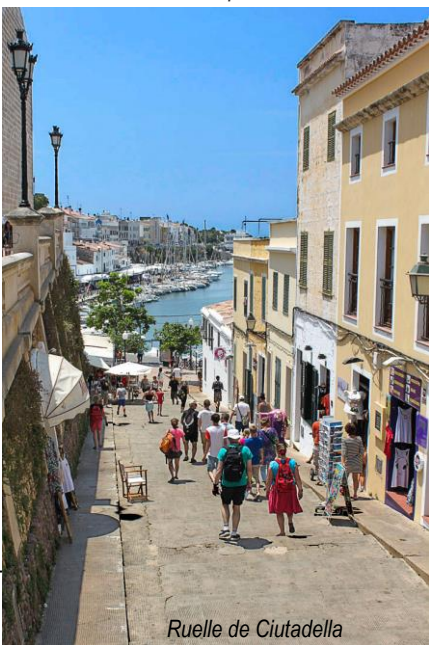
Ruelle de Ciudadella

Le Bravo Club Menorca est à seulement 11 km de Ciudadella , petite ville très animée avec ses restaurants de poissons autour de son petit port et ses nombreux bars à tapas.