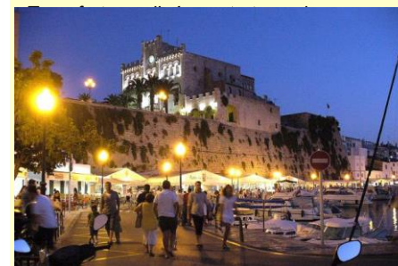
Ci-dessus Ciudadella by night

Vous voilà appelés, malheureusement, pour le retour en France !