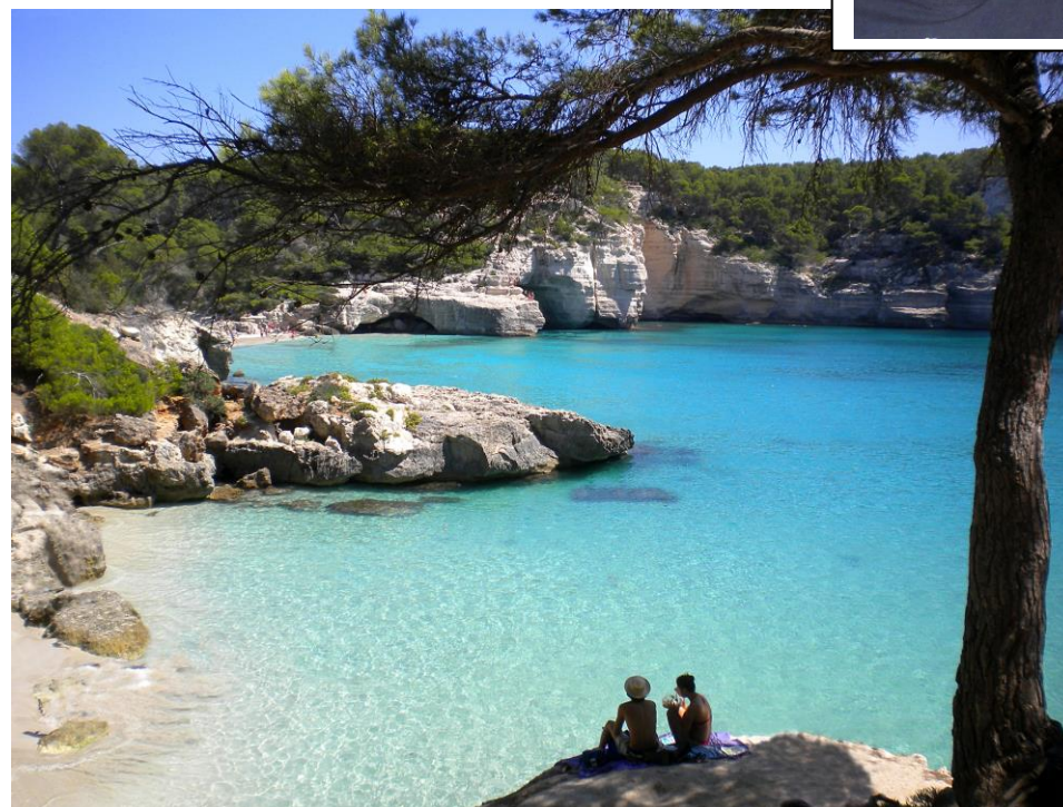
Plages secrètes enchevêtrées parmi les criques

Départs de : Paris, Lyon et Nantes (départs de Province sous réserve de disponibilité au moment de la réservation)